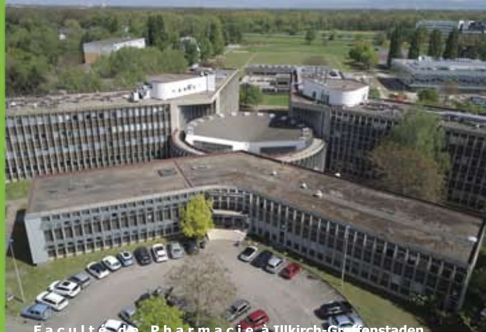
Faculté de Pharmacie à Illkirch-Graffenstaden

Graphic Design : Association Touch-Arts.com